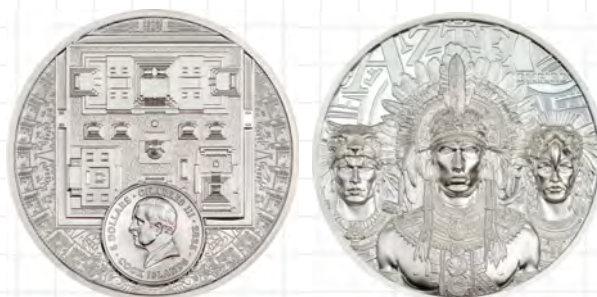
Cook Islands, 5 Dollars 2025, 999,9er Silber, 1 Unze, Proof, 999 Ex., Spezialtechnik: smartminting® (Ultra High Relief), geprägt bei B. H. Mayer's Kunstprägestalt, München.

Die Bildseite zeigt den letzten Herrscher der Azteken: Cuauhtémoc trägt die opulente Federkrone und den Brustschmuck, beides zum großen Teil aus purem Gold, jenem Gold, das den Azteken zum Verhängnis wurde. Der junge Cuauhtémoc gilt heute als tragischer Held, der sein Volk bis zuletzt gegen die Spanier verteidigte. Nach seiner Gefangennahme erlitt er mehr als drei Jahre der Demütigung und Folter, bis ihn Cortez unter einem Vorwand hängen ließ. Links und rechts von Cuauhtémoc stehen Vertreter des aztekischen Heeres. Die Ausrüstung von Jaguar- und Adlerkriegerern erinnert an die Tiere, nach denen sie benannt waren. Von den