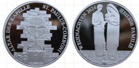
Der 23. Neumarkter Weihnachtstaler 2024 ist dem Missionsseminars St. Paulus-Comboni gewidmet und zeigt den Hochaltar des Missionsseminars St. Paulus sowie die lebensgroßen Krippenfiguren Maria, Josef und Jesuskind.

Der Ordensgründer Daniele Comboni wurde am 15. März 1831 in Limone am Gardasee geboren. Der Ordensgründer wollte in Zentralafrika Missionsarbeit betreiben. Die religiöse Komponente war dabei nur ein Teil. Gesundheitsfürsorge und Bildung waren weitere Bestandteile des Einsatzes. Am 10. Oktober 1881 verstarb Daniel Comboni im Alter von 50 Jahren in Chartum im Sudan. Er wurde 1996 seliggesprochen, die Heiligsprechung erfolgte im Oktober 2003.