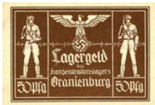
Konzentrationslager Oranienburg, Rückseite des 50-Pfennig-Scheins von 1933.

3)