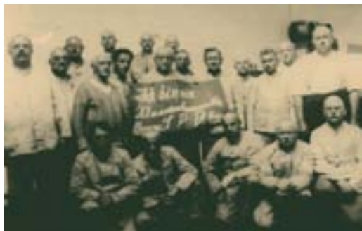
Konzentrationslager Dachau, im Sommer 1933 verhaftete SPD-Funktionäre.

Besonders die SA (Sturmabteilung) ging danach brutal und willkürlich gegen Kommunisten, linke Intellektuelle, Publizisten sowie Sozialdemokraten und Gewerkschaftsfunktionäre vor, bis sie schließlich nach dem sog. „Röhmputsch“ im Sommer 1934 entmachtete wurde. Es entstanden erste „Schutzhaftlager“, bei denen jedoch noch keine einheitlichen Strukturen vorhanden waren. 1933/1934 gab es in Deutschland mindestens 70 Konzentrationslager und 30 Schutzhaftabteilungen, in denen im Laufe des Jahres 1933 mehr als 80 000 Menschen inhaftiert wurden. Die meisten dieser Lager bestanden nur kurze Zeit und nur wenige wurden länger als ein Jahr genutzt. Eine Ausnahme bildete Dachau, das bis zum Kriegsende Konzentrationslager blieb. 2)