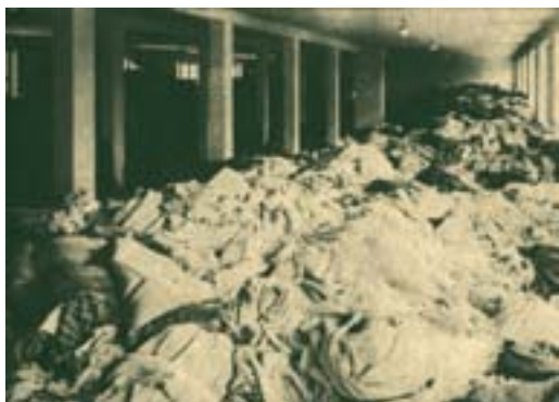
Vernichtungslager Auschwitz II-Birkenau, Berge von Bekleidung ermordeter Juden in einer Effektenkammer.