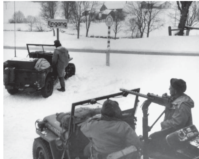
Amerikanische Soldaten patrouillierten zur Grenzsicherung, bevor der Eiserner Vorhang mit Zäunen, Stacheldraht Minengürteln und elektrischen Fallen dem ungesetzlichen, aber gebräuchlichen Grenzübertritt für Jahrzehnte ein Ende setzte.

Wenn wir in alten Photos den alten und wieder sehr lebendigen Kulturraum Böhmerwald betrachten, mischen sich ferne Bilder, die kaum noch auf unmittelbare Erinnerungen gründen, mit jüngeren, die uns näher liegen. Die Patrouillen amerikanischer Soldaten, aber auch die Milchbänke an den Landstraßen sind uns heute schon ebenso reine Erinnerung ohne irgendwelche ding-