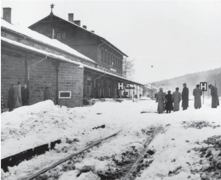
In Bayerisch Eisenstein führt die Grenze mitten durch den Bahnhof. Die Journalistin Erika Groth-Schmachtenberger hat 1952 Menschen photographiert, die hinüberschauen in die böhmische Heimat, aus der sie 1946 vertrieben wurden.

zu merken ist, von bildungsfernen Menschen mit dem fremdsprachigen bezeichnet werden. Leute, die nie sagen würden, dass sie ein Wochenende in Venetia, Brunico oder Firenze verbringen wollten, sagen Prachatice, Vimperk und Klatovy. Bei Česky Krumlov lassen sie sich gerade noch herab, es Krummau zu nennen, sie schreiben es allerdings falsch mit einem „m“. Immerhin sagen sie noch Prag statt Praha. Budweis hat das Glück, dass seine tschechische Entsprechung Česke Budějovice für deutsche Zungen etwas schwierig ist. Auffällig ist, dass sich bei vielen Menschen, die in Bayern aufgewachsen sind, bei einem Besuch in den alten böhmischen Ort-