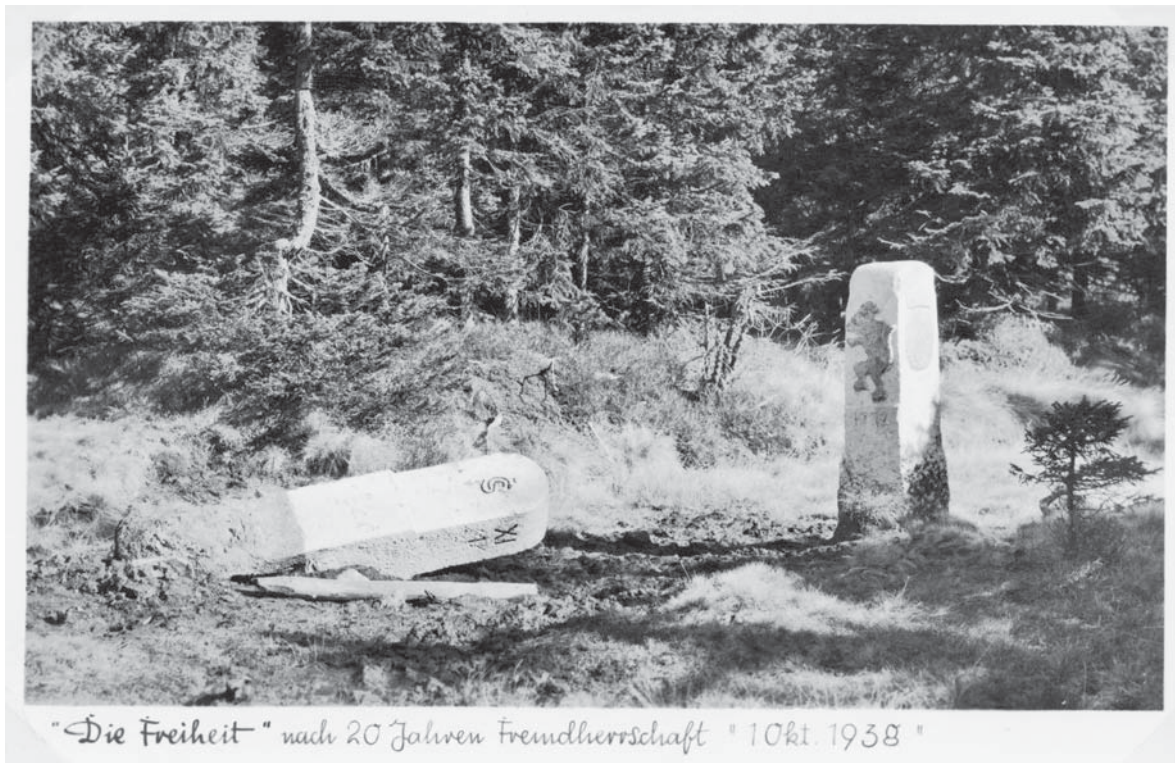
"Die Freiheit" nach 20 Jahren Fremdherrschaft " 10kt. 1938 "

Dokument gewaltsamer Grenzverrückung: Der Grenzstein mit den ver- schlungenen Buchstaben ČS für Tschechoslowakei wurde umgestürzt, als am 1. Okt- ober 1938 Teile der Republik von den Deutschen besetzt wurden. Kurz darauf wurde das gesamte Nachbarland ein- genommen.