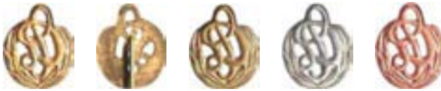
1 Rs Var. 2 3