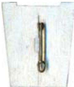
64 Rs (80)