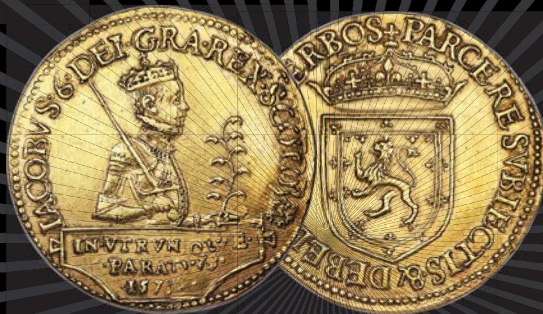
Scotland: James VI (I of England) gold 20 Pounds 1575 XF40 NGC