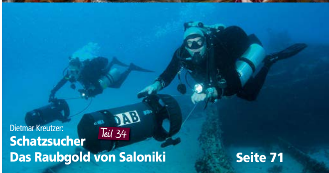
Dietmar Kreutzer: Schatzsucher Teil 34 Das Raubgold von Saloniki Seite 71