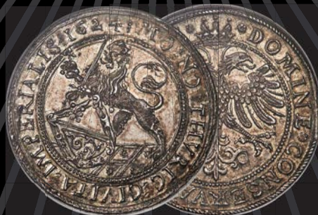
Switzerland: Zurich. Canton 2 Taler 1624 MS65+ NGC