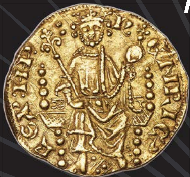
Great Britain: Henry III (1216-1272) gold Penny of 20 Pence ND (c. 1257) MS63 NGC

The First Gold Coin of England – The Likely Finest Example of a Fabled Rarity From the Penn Collection