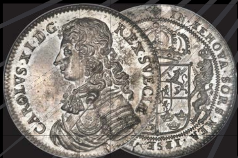
Sweden: Charles XI Riksdaler 1676 MS66★ NGC