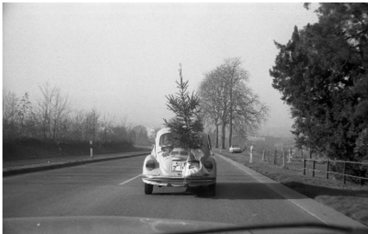
VW-Käfer mit Weihnachtsbaum am Heck