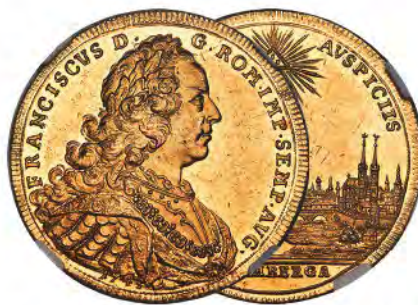
German States: Nürnberg. Free City gold 6 Ducat 1745-PPW MS60 Prooflike NGC