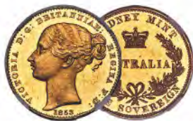
Australia: Victoria gold Proof Pattern Sovereign 1853 PR63 Ultra Cameo NGC