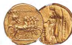
CYRENAICA. Cyrene. Ophellas, Ptolemaic Governor (ca. 322/1-308 BC). AV stater NGC Choice AU★ 5/5 - 5/5, Fine Style