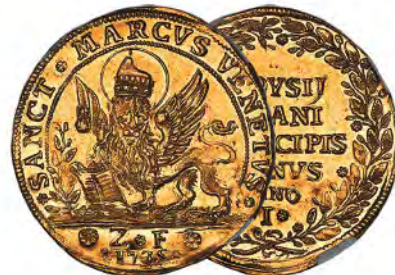
Italy: Venice. Alvise Pisani gold Osella of 4 Zecchini Anno I (1735)-ZF MS64 NGC