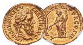
Pertinax (1 January-28 March AD 193). AV aureus NGC Choice MS 5/5 - 5/5