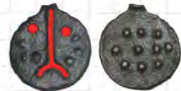
Gussbronze aus Hengistbury, ca. 40-50 n. Chr., ABC-, £ 650.