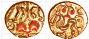
South Ferriby Goldstater, ca. 45-10 v. Chr., ABC-, £ 2400.