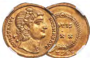
Constantine I the Great, as Augustus (AD 307-337). AV festaveus or 1-1/4 solidus medallion NGC MS★ 5/5 - 5/5