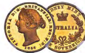
Australia: Victoria gold Proof Pattern Sovereign 1856 PR65★ Ultra Cameo NGC

Accepting consignments year-round for Select, Showcase, and Signature® Auctions. Contact a Heritage Consignment Director today for a free appraisal of your collection. Generous cash advances and competitive purchase offers available.