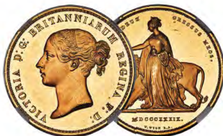
Great Britain: Victoria gold Proof "Una and the Lion" 5 Pounds 1839 PR62 Ultra Cameo NGC