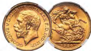
Australia: George V gold Sovereign 1920-S MS64+ NGC